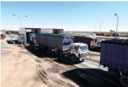
於噶順蘇海圖過境

柏油路的修建工作正按計劃進行，於二零一一年六月三十日，項目的整體竣工率約為86%，共有105公里指定路線已完成鋪設。沿途四個檢查站的收費站、收費控制IT系統及配套建築正在建設中，而有關道路使用的維護計劃以及營運及法律文件亦正在備製中。預計該項目將於二零一一年第三季完成。